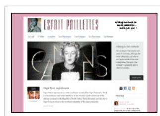
Blogs et sites médias